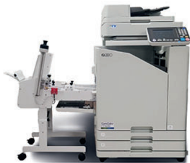
Le nouveau margeur d'enveloppe

Associé à la technologie d'impression FORCEJET™, il imprime en continu tous vos formats d'enveloppes (C6, DL, C5/6, C5 ET C4) avec ou sans fenêtre, en noir et en couleur. Il permet une capacité jusqu'à 7 200 enveloppes/heure avec un ComColor FT5430 EII ou GL7430.