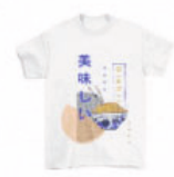
La Fespa en image

Certains visiteurs ont pu repartir avec un t-shirt imprimé sur place avec ses visuels.