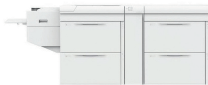
Xerox High Capacity XLS Vacuum Feeder version 2

La productivité obtenue, grâce à ces modules combinés aux capacités d'ennoblissement en ligne des presses Xerox, vous permet aujourd'hui