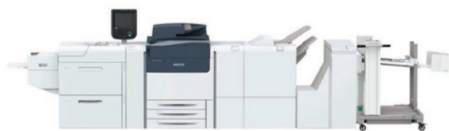
Xerox Versant 280/4100

Les presses Xerox Versant 280/4100 et Iridesse sont désormais configurables, en entrée, avec des modules d'alimentation grande capacité jusqu'au format bannière et empileuse adaptée en sortie.