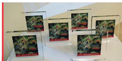
Les trophées des Xerox Creative Awards 2021

Bravo à tous les participants enthousiastes et audacieux qui ont relevé le défi de main de maître, (Nous avons reçu 33 travaux d'impression répartis sur 11 participants), félicitations aux talentueux lauréats, et rendez-vous l'année prochaine pour une édition qui s'annonce déjà relevée !