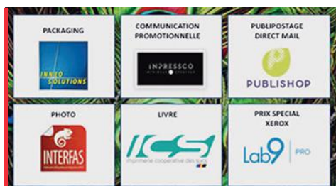
Les lauréats des Xerox Creative Awards 2021

Pour sa 2 ème édition, le concours était élargi à la Belgique et au Luxembourg.