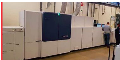
Presse jet d'encre Baltoro