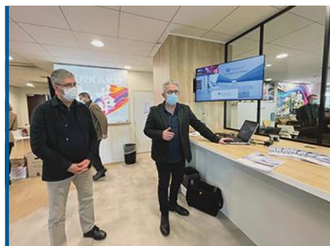
Présentation de la solution Prinéo7 lors de la journée dédiée au RUG au show-room CIP Ricoh France