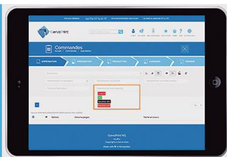
Suivi de production