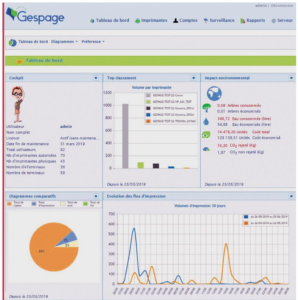
Le tableau de bord de la solution Gespage

Le module embarqué eTerminal Gespage couplé à un lecteur TCM4-IZLY permet le paiement des photocopies, impressions et scans au moyen d'une carte étudiante IZLY. L'écran tactile du MFP permet l'affichage des impressions en attente. L'utilisateur peut ainsi sélectionner ses documents puis les libérer après paiement. Le paiement s'effectue en passant sa carte étudiant IZLY, sans contact sur le lecteur TCM4.