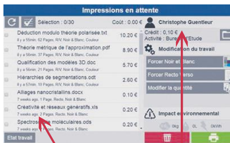
Choix de ses impressions en attente

Grâce à ce système, les étudiants peuvent procéder au paiement de leurs copies et impressions.