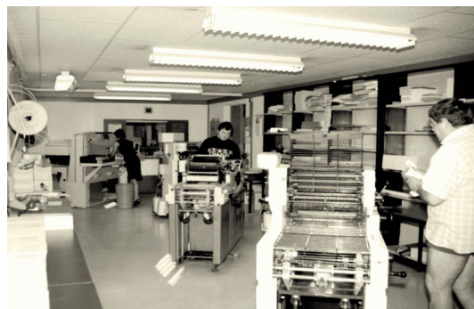
L'atelier avant 1999

L'historique du service remonte à l'année de toutes les frondes, à savoir 1968. Le service, situé au 3ème étage de l'ancienne université des