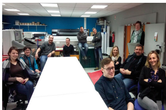
L'équipe de l'imprimerie