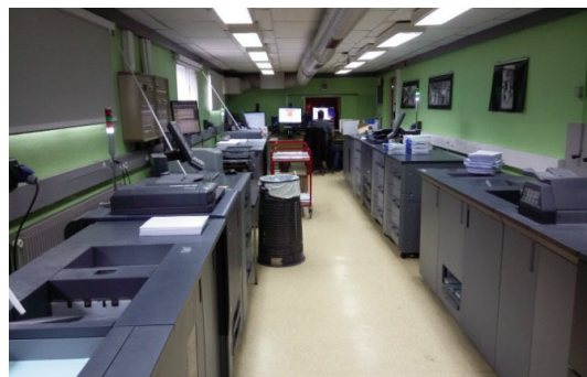
Atelier de production actuel