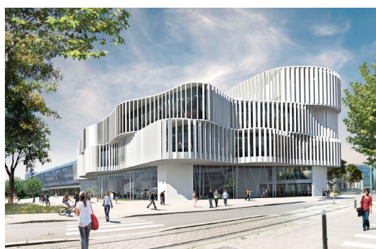
Le futur bâtiment prévu pour la rentrée 2019

À l'université de Strasbourg, cette acquisition représente un rouage essentiel du processus de mutualisation et de rationalisation des flux de production. Prioriser l'intelligence et les ressources du print au sein de ce grand établissement, né de la fusion des 3 universités strasbourgeoises en 2009, était devenu un objectif prioritaire.