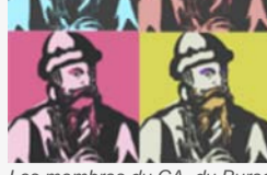
Les membres du CA, du Bureau et le Président ont été élus à l'unanimité.