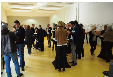
Buffet XEROX clôturant l'AG de Nancy

Tout courrier écrit sous le nom de l'association doit être systématiquement accompagné de son logo [à télécharger sur le site] et être validé par le président.