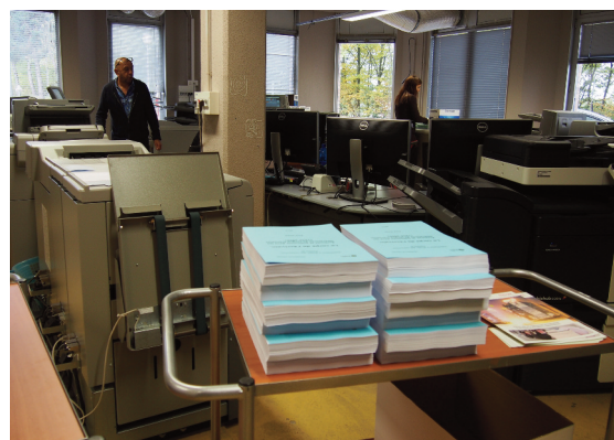
Le pôle impression noir-blanc