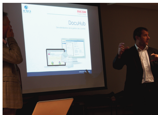
Démonstration de DocuHub (RICOH)