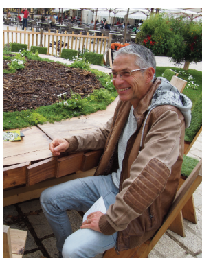
Un endroit pour une AG Rodolphe, jardins éphémères Nancy, Place Stanislas

présente des interfaces conviviales, aussi bien du côté de l'utilisateur, que du côté gestion-atelier.