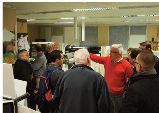
Le responsable du pôle PAO explicite ses démarches