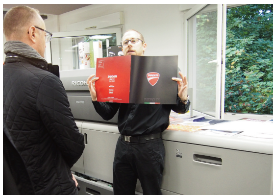
Démonstration du C9100 au pôle couleurs

Les choses techniques, avec la visite des différents ateliers se trouvant sur le site de Nancy, nous ont été réservées pour le jeudi. Dès le matin, un déplacement en tram a amené les participants sur le site du Montet, qui domine la ville. Ici, le choix a été fait de concentrer la production sur trois pôles principaux, que nous avons visité par groupes à tour de rôle.