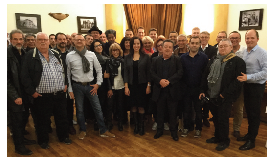
Le groupe RUG à l'Excelsior