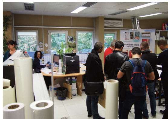
Pôle PAO - impression grand-format