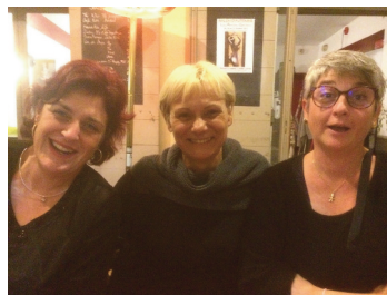
Les Dames du RUG