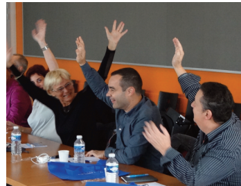
...réélu à l'unanimité