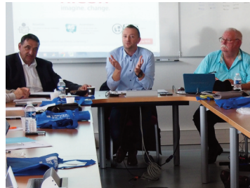
Le Président du RUG...