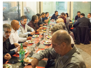
Repas du soir

De manière inattendue, le temps n'a pas vraiment été de la partie pour cette AG. Ce qui n'a aucunement entravé la bonne humeur de tout le monde ! Cependant, nous comptons bien nous rattraper en matière météorologique lors de l'AG 2017, qui aura sans doute lieu dans l'est de la France... nous sommes pour l'heure toujours dans l'attente de la validation officielle.