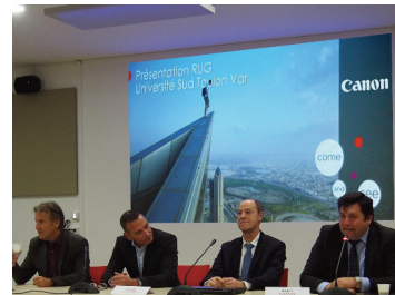
Intervention de la société CANON

et membres du RUG. L'intervention de RISO-France mettait l'accent sur son engagement en faveur de l'environnement, concrétisé par son partenariat lors des deux récentes conférences internationales sur le réchauffement climatique. CANON-France, partenaire de l'université de Toulon pour le projet de mise en place d'un réseau d'impression de proximité, communiquait sur l'excellence reconnue de ses équipements en termes de qualité d'impression.