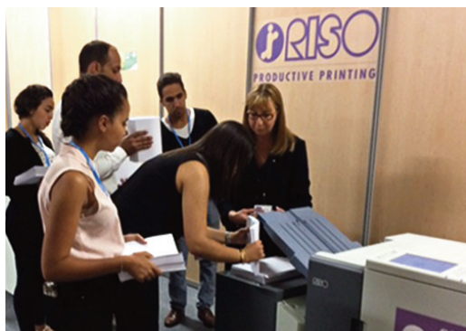
Production lors de la COP22

L'équipe technique RISO présente a eu à sa disposition un parc de 5 imprimantes ComColor, pour imprimer pendant les 12 jours de la conférence, tous les documents préparatoires des différentes commissions, ainsi que les traités, signés par les plus grands décideurs mondiaux.