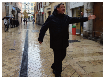
éh oui... il pleut toujours !

Compte-rendu, photos et documents sont à retrouver sur notre site dans la section réservée aux adhérents.