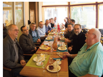
Repas du midi