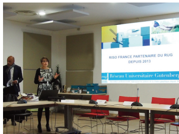
Intervention de la société RISO