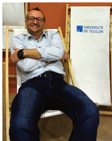
Démonstration pratique d'utilisation d'un bain de soleil en intérieur (Université de Toulon, octobre 2016)