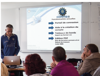
Démonstration de l'application CONNEX