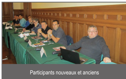
Participants nouveaux et anciens