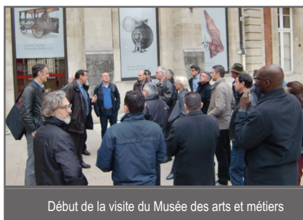
Début de la visite du Musée des arts et métiers