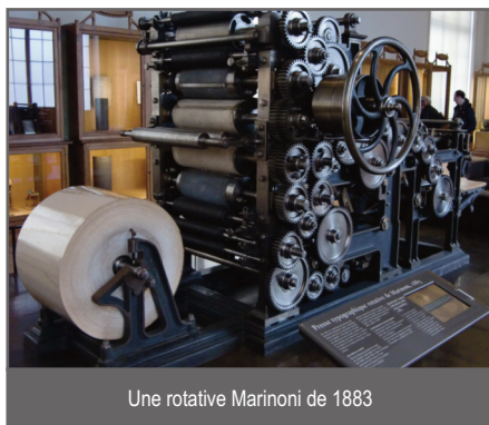
Une rotative Marinoni de 1883