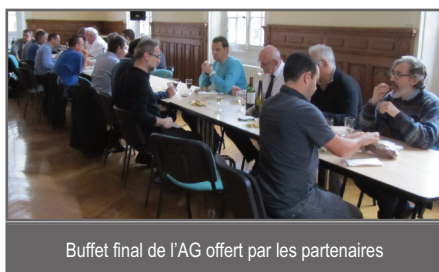
Buffet final de l'AG offert par les partenaires